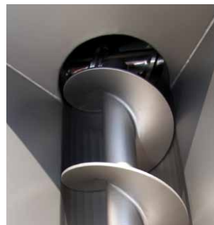
Schonender Transport Ensure gentle transport