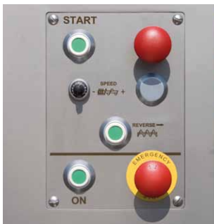
Einfache Bedienung Simple handling