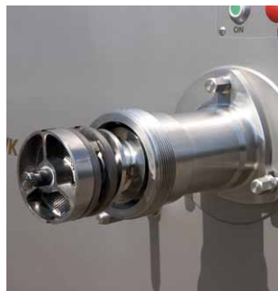
Unger-Schneidwerk Unger cutting system