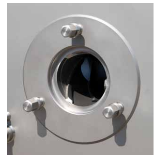
Perfekte Hygiene Perfect sanitary